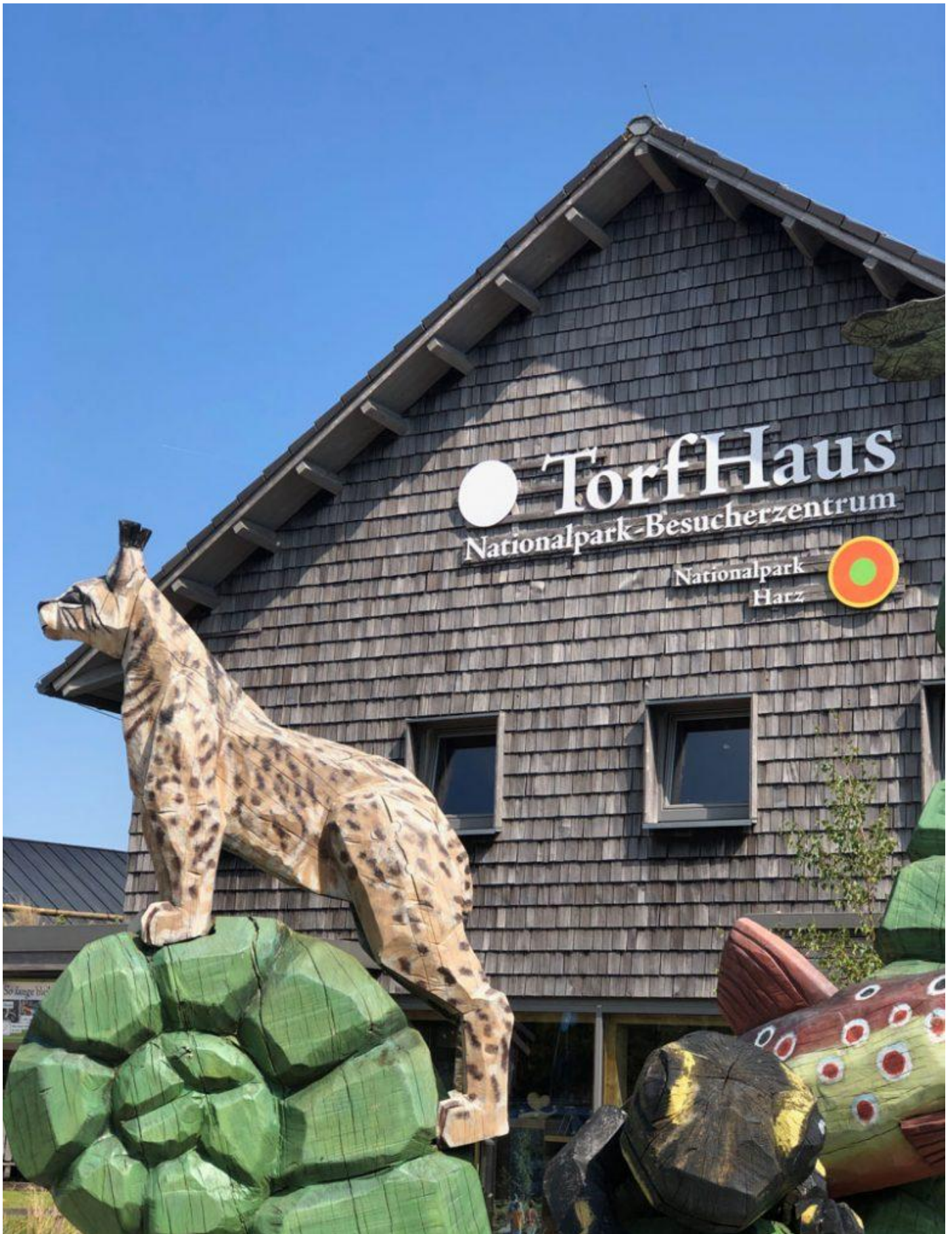
Der Goetheweg zählt zu den beliebtesten Wanderwegen im Harz und wurde nach dem