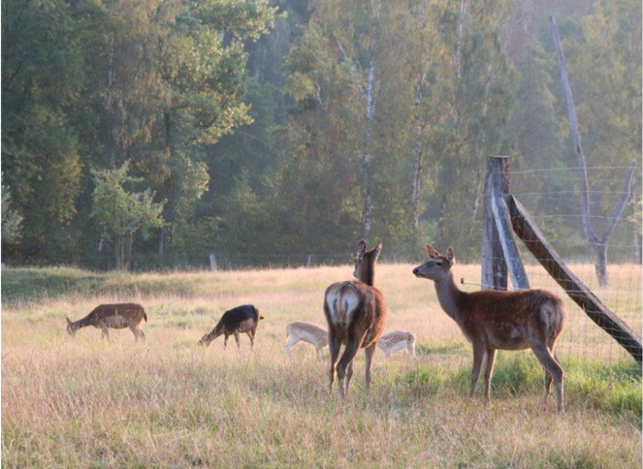
Mein Blick aus dem Schlafzimmer

Meine Wohnung »Hester Street« zählt definitiv zu den schönsten Ferienwohnungen, in denen ich bisher übernachtet habe. Ich habe sogar noch zwei Nächte an meine Reise drangehangen. Das ganz Besondere an dieser Wohnung war für mich, dass ich nachts die Schlafzimmer-Türen nach draußen offen lassen und morgens die Rehe vom Bett aus beobachten konnte. Einfach unglaublich schön!