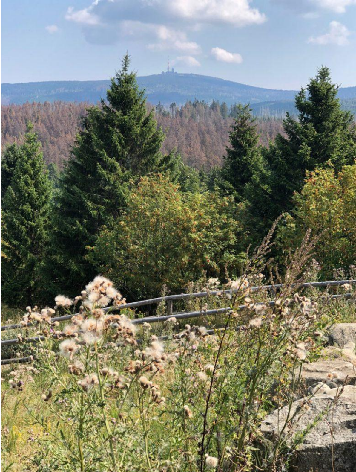
Blick von Torfhaus auf den Brocken

Dichter Johann Wolfgang von Goethe benannt, der diese Wanderung im Jahre 1777 angetreten haben soll. Für den mittelschweren Hin- und Rückweg von insgesamt 18 km solltest du – mit einer Pause oben – mindestens 6-7 Stunden einplanen. Wenn dir das zu anstrengend ist, gibt es alternativ noch andere Wanderungen.