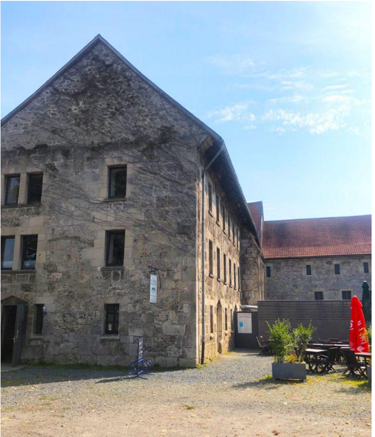
Klostercafé des Zisternerklosters Walkenried