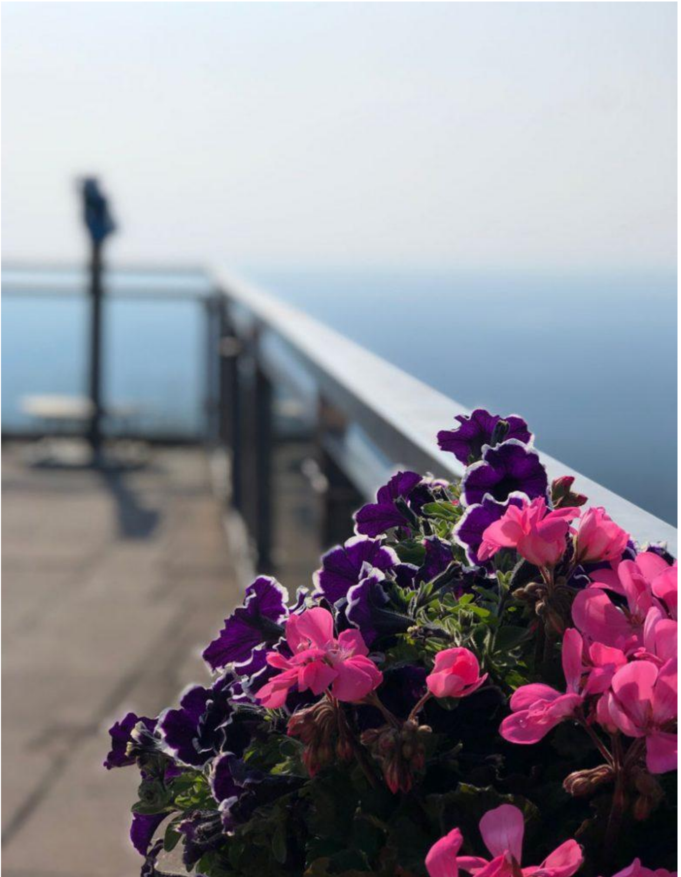
Ausblick von der Wurmberg Alm

Von hier oben gibt es bei gutem Wetter ohne Nebel einen fantastischen Rundum-Blick. Ungewöhnlich wirkt so hoch oben auf der Bergstation der künstlich angelegte See. Er