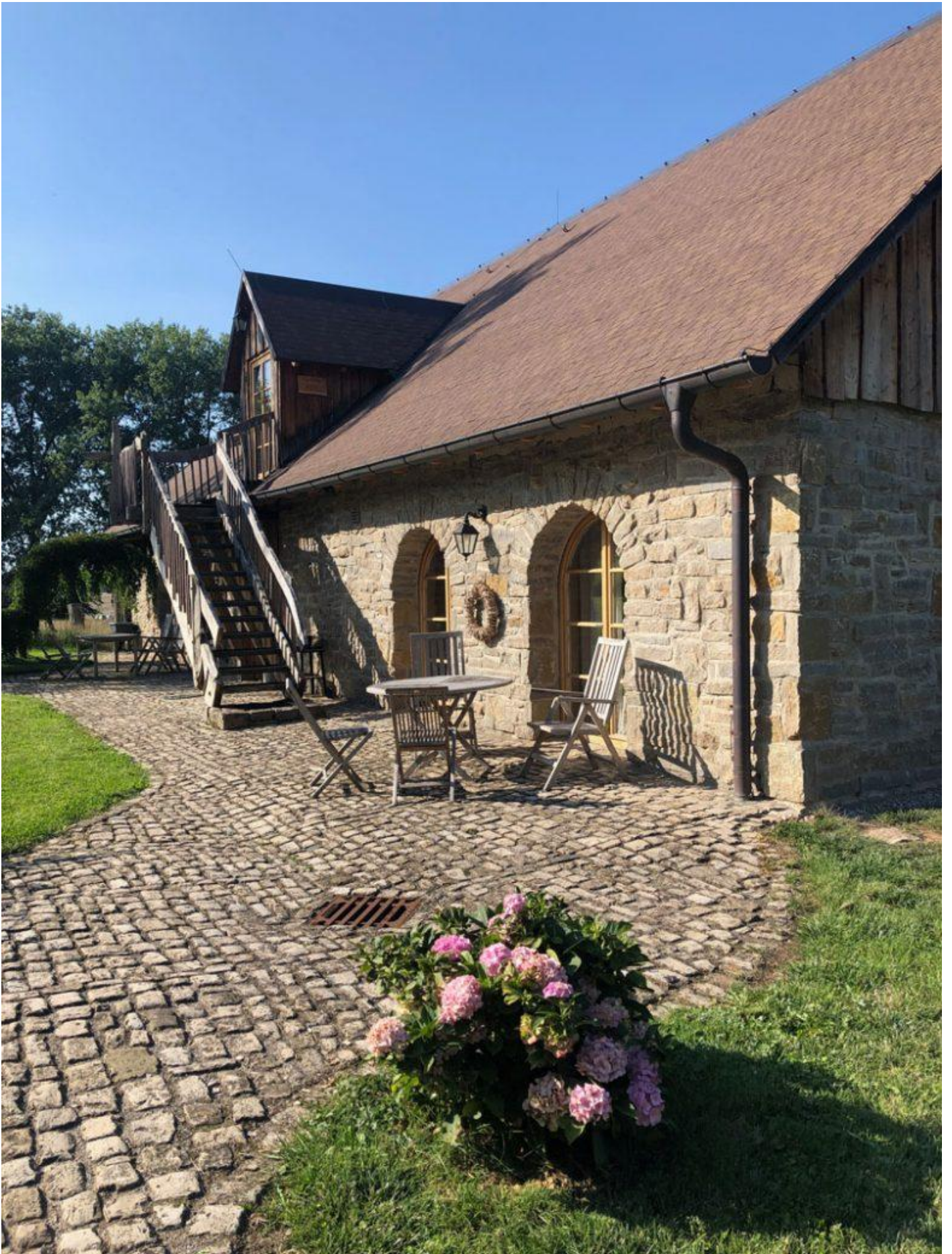
Earl's Lane Hideaway Cottage