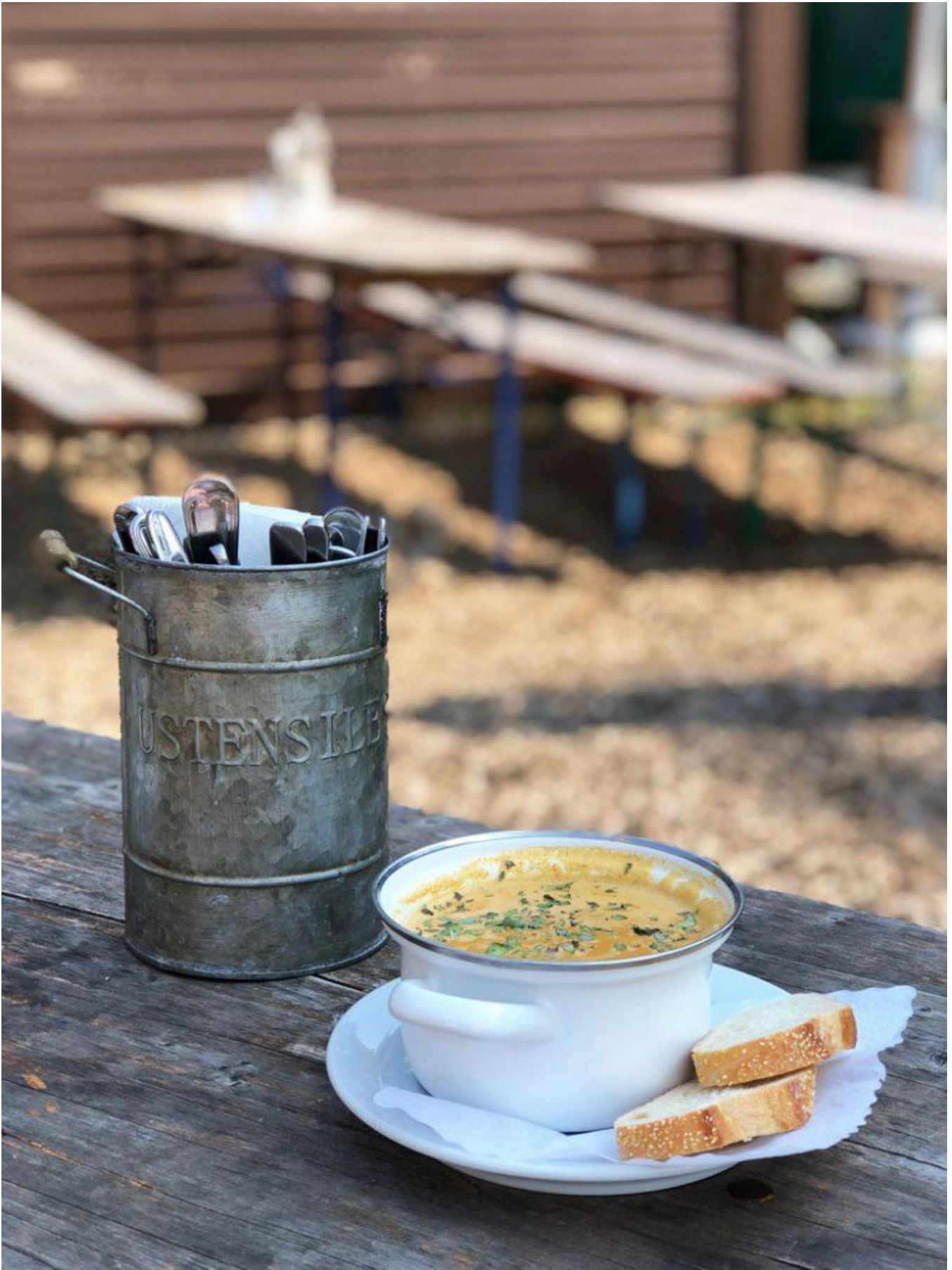
Mittagspause auf der Terrasse des Restaurants Rodelhaus