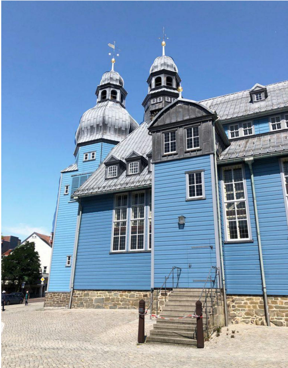
Marktkirche zum Heiligen Geist in Clausthal-Zellerfeld